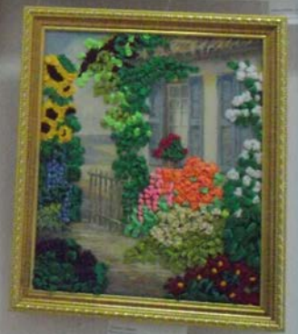
Small white label with illegible text.