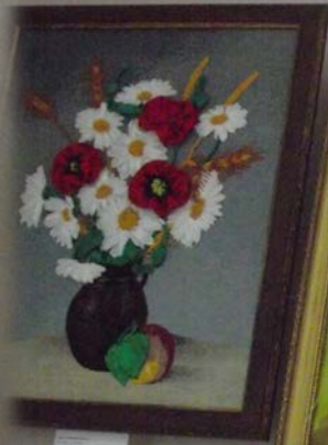
Small white label with illegible text.