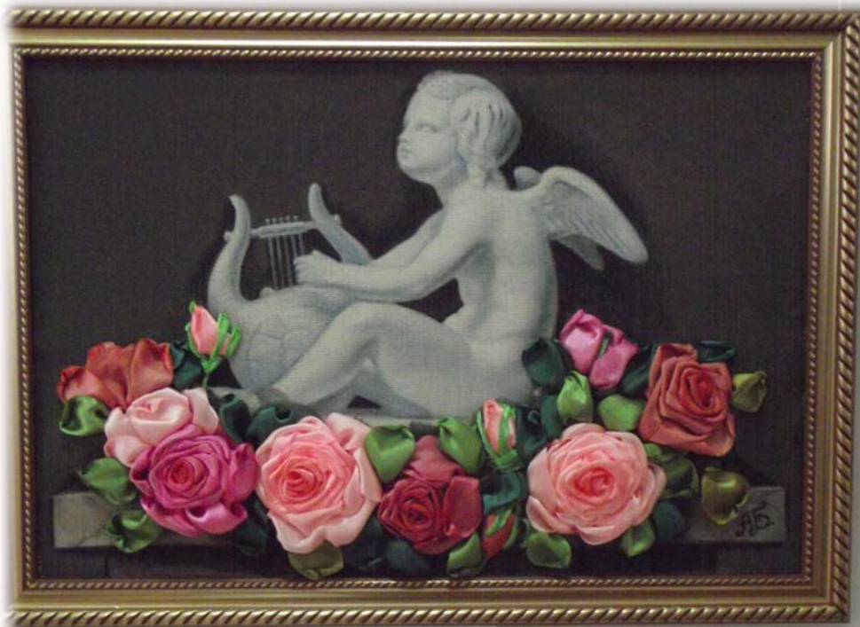
«Розовая гармония» Вышивка, текстиль авт. Елена Анисимова 2020 Выш. Елена Анисимова Анисимовна