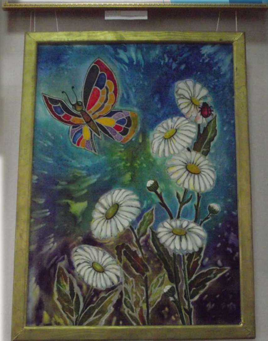
«Летнее настроение» Вышивка, текстиль авт. Елена Анисимова 2020 Выш. Елена Анисимова Анисимовна