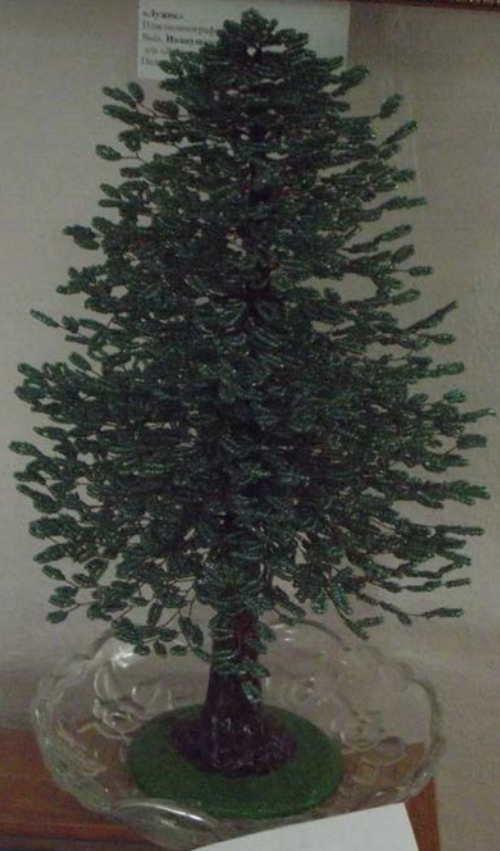
«М. П.» Инициалы или отчество Имя, Инициалы или отчество