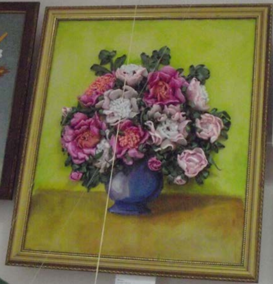
Small white label with illegible text.